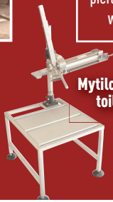
Mytilclip pour sac toile ou jute

Saujon (17) www.cmagro.fr cmagro@sfr.fr 05 16 35 30 82